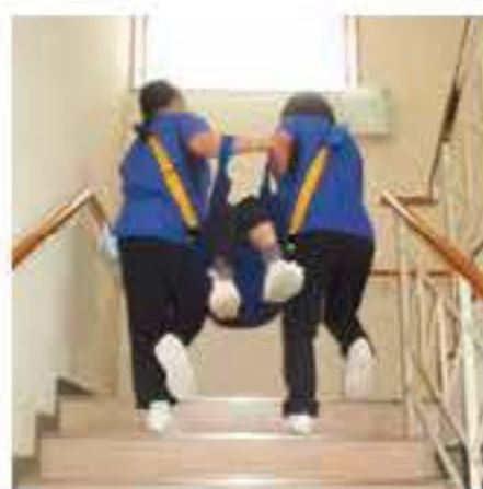
ソフト担架を利用した搬送訓練

利用を訓練しました。水平移動についてはスムーズに行えたという意見が多く、垂直避難についてはエレベーター前の密集や、階段を使っ