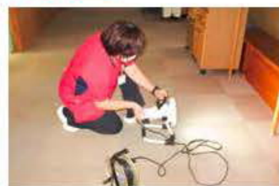
非常電源を用いたサーチライト照度訓練

令和6年9月27日(金)、あうん高知入所、通所リハビリ合同の風水害避難訓練を行いました。訓練想定は、台風接近に伴い、高知市全域に大雨警報、暴風警報、竜巻注意情報が発表されたとして、竜巻や暴風に備えての水平移動(窓側から離れる)と水害に備えて垂直移動(低層階から上階へと移動)を行いました。上階への移動手段として、①エレベーター(大規模災害時とは異なり、エレベーターも一部使用できる状況下)②ソフト担架③シーツ